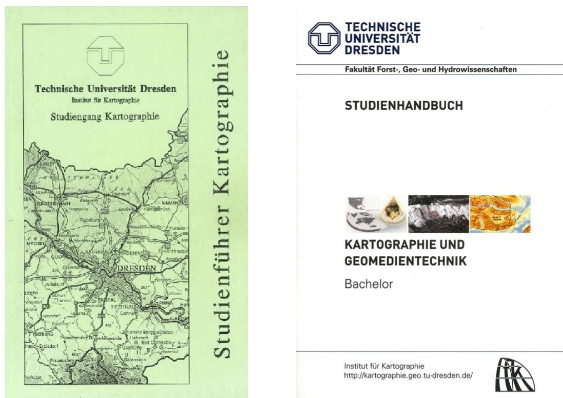
Abbildung 1: Studienführer von 1998 (links) und Studienhandbuch von 2008 (rechts) - Umschlagbilder

Erst mit der Umstellung der Diplomstudiengänge im Freistaat Sachsen in Bachelor- und Masterstudiengänge (Bologna-Reform, um 2008/09) wurde an der TU Dresden der traditionelle kartographische Diplomstudiengang in einen dreijährigen Bachelorstudiengang „Kartographie und Geomedientechnik“ umgebaut (Umschlagbild des Studienhandbuchs von 2008 s. Abb. 1 re.) und den Absolventen eine Fortsetzung des Kartographiestudiums im zweijährigen Masterstudiengang „Geoinformationstechnologien“ empfohlen.